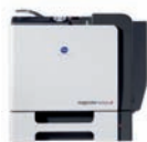
magicolor 5650 EN-d et magicolor 5670EN-d avec recto-verso

En dehors du PCL et du PS, les deux imprimantes fonctionnent avec le format XPS de Microsoft Vista™. Et dotées d'une mémoire prodigieuse (jusqu'à 1 024 Mo), elles dopent littéralement la productivité de n'importe quel environnement de bureau.