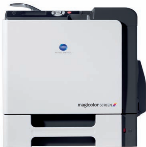
magicolor 5650EN et magicolor 5670EN Configuration standard

Accueillez dans votre bureau la magicolor 5650EN et la magicolor 5670EN comme les plus parfaites des solutions d'impression couleur à haute efficacité. Dotées de la technologie de contrôleur Emperon™ la plus récente, ces imprimantes polyvalentes ne laissent rien à désirer quand il s'agit d'imprimer rapidement des documents couleur pour de petites équipes de travail. Et grâce à leur mode efficace d'économie de toner, impression haute qualité et utilisation économique ne sont plus incompatibles. Leur flexibilité extrême est assurée par toute une gamme d'options attractives permettant d'ajouter à l'imprimante des bacs papier supplémentaires, une unité recto-verso, un disque dur et un module de finition.