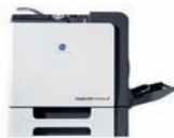
magicolor 5670EN (MPC) avec bac multiformat pour papier épais et formats spéciaux