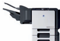
magicolor 5670EN-dthf avec recto verso, bac papier sup- plémentaire, disque dur 40 Go et module de finition tri et agrafage