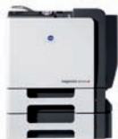
magicolor 5670EN-dth avec recto verso, bac papier supplémentaire et disque dur 40 Go